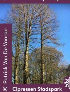
Cipressen Stadspark