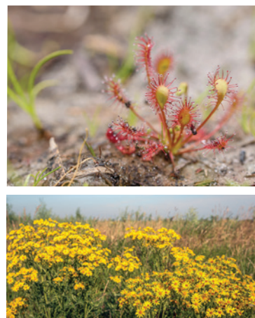
Jacobskruiskruid, Kleine zonnedauw

(1942-1981) en een 'plantenalbum' (1948-1980) van de wilde planten die hij aantrof op het grondgebied van Turnhout. Vanaf 1948 tot zijn plots overlijden begin 1982 bleef hij daaraan werken: duizenden losse bladen tekst in een prachtig handschrift en honderden tekeningen in Chinese inkt zijn het resultaat.